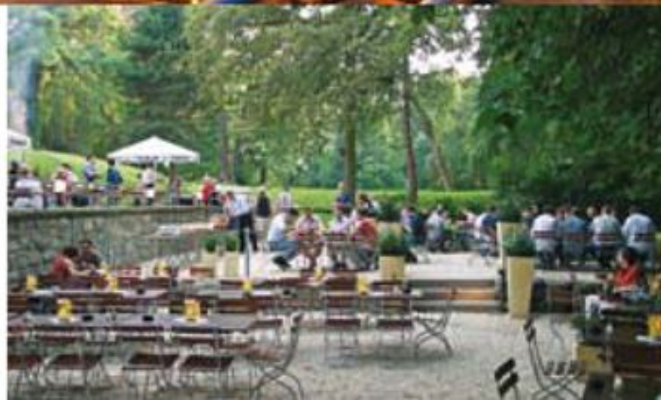
Gesellige Runde im idyllischen Biergarten.