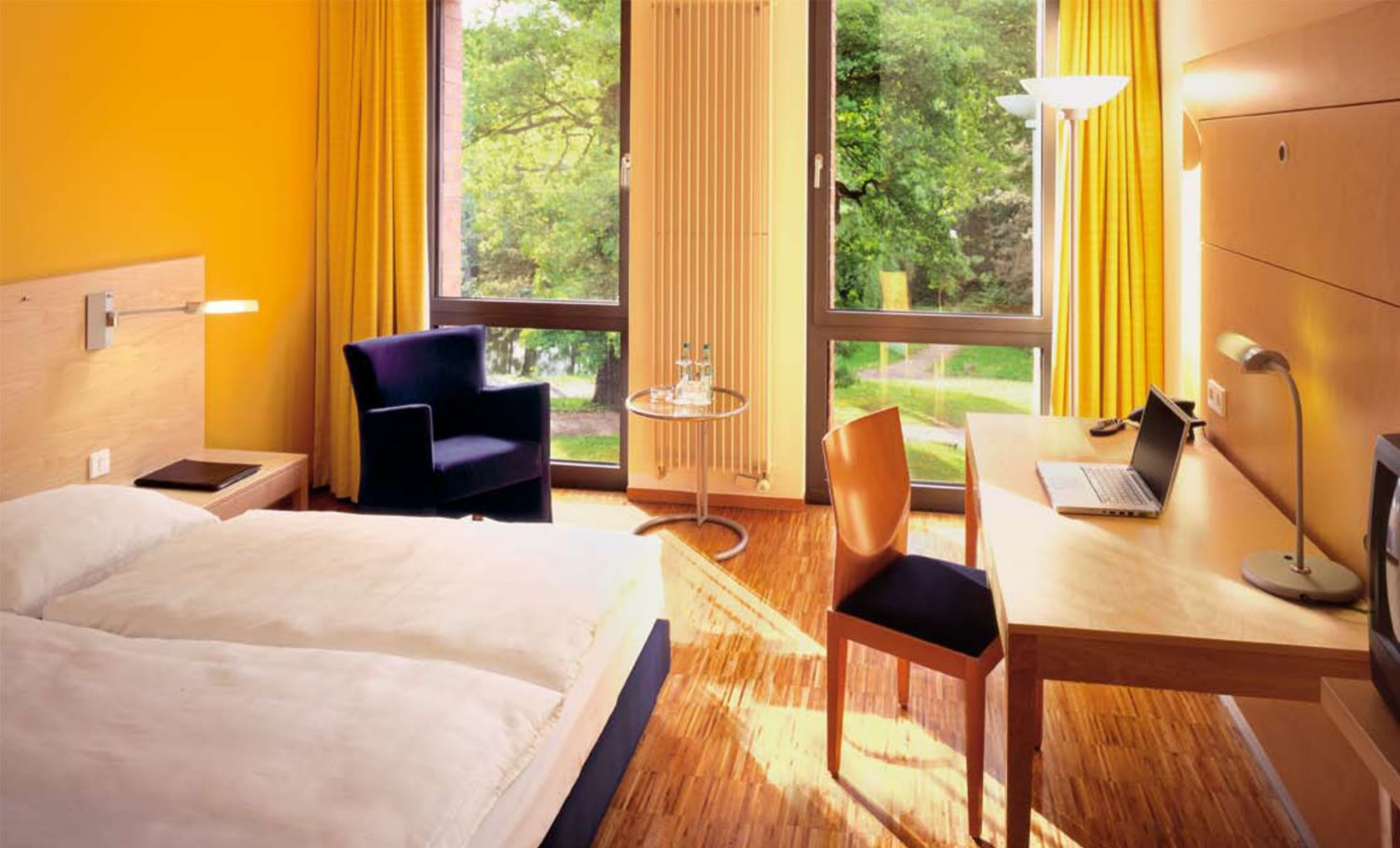
Komfortabel wohnen und konzentriert arbeiten: Die großzügigen Zimmer im Arcadéon.