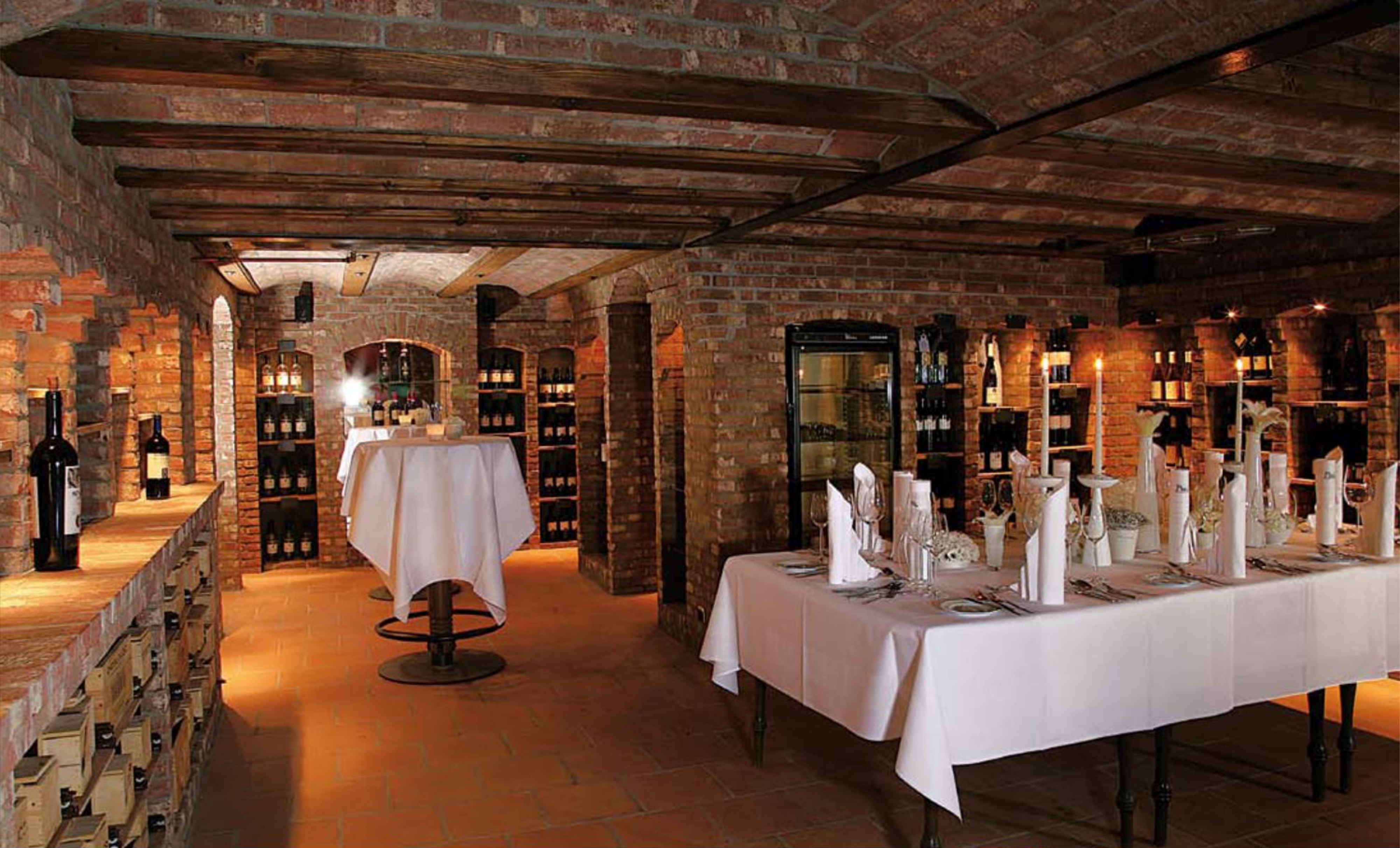
Private Feiern und Empfänge in überzeugendem Ambiente: Der Weinkeller im Landhotel Halden.